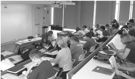
Jedna od preporuka OECD-a je finansijsko obrazovanje u školama

Finansijsko obrazovanje je samo jedan stub adekvatne finansijske politike za unapređenje finansijske pismenosti i pristupa finansijskim uslugama. Ono može dopuniti ali ne i zameniti druge aspekte uspešne finansijske politike, kao što su zaštita potrošača i regulisanje finansijskih institucija.