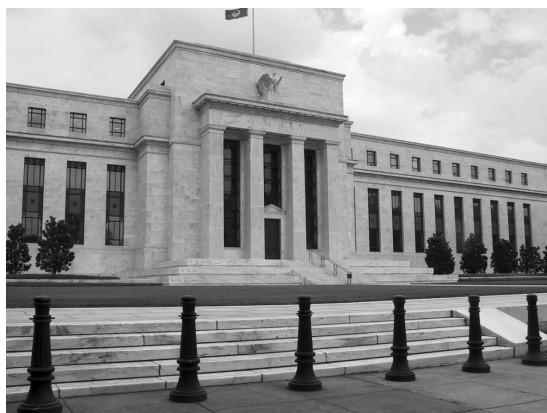
Federalne rezerve SAD, Vašington

Svaka rasprava o finansijskoj edukaciji je prvenstveno usmerena na pojedince (građane), koji obično imaju ograničene resurse i znanja za ocenjivanje složenih finansijskih aranžmana sa finansijskim posrednicima a u vezi njihovih ličnih finansijskih pitanja.