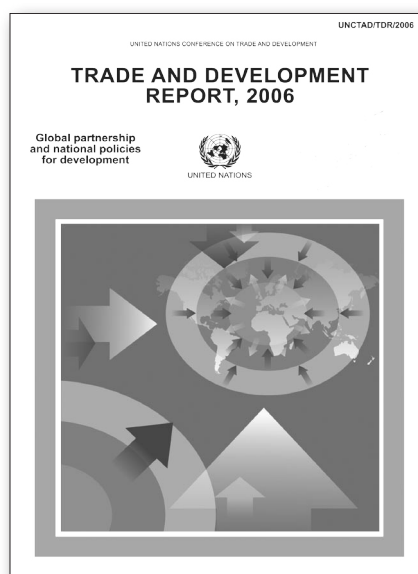
Poslednji Izveštaj UNCTAD-a, Komisije UN za trgovinu i razvoj

nacionalnu deviznu kontrolu koja je neophodna privredama u razvoju, 2. liberalizacija bi mogla da umanjí efikasnost monetarnih politika, koja se u zemljama u razvoju, zbog nerazvijenih tržišta novca, oslanja na kontrolu kredita i kamatnih stopa, 3. kontrola kreditne alokacije, koju su mnoge razvijene zemlje koristile za svoj početni razvoj, nije u skladu sa tržišnim bankarskim sistemom i 4. nerazvijeno