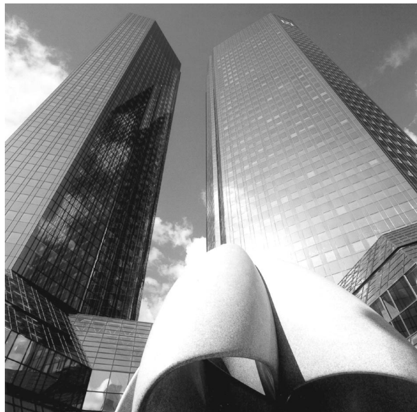
Deutsche banka smatra da treba da ide i preko postavljenih deset principa, ne zato što su oni dobrovoljni, nego zato što banka smatra da je to njena odgovornost

kada dođe do pojave neke prirodne nepogode ili nesrećnog slučaja na međunarodnom nivou, iznenada dolazi do drugačijeg shvatanja globalizacije: tada nastupa solidarnost. Međunarodna praksa pokazuje da i u takvom shvatanju globalizacije, bankarski sektor veoma brzo reaguje i učestvuje u solidarnosti. O tome svedoči primer jedne velike banke sa 100.000 zaposlenih, aktivne u 70 zemalja sveta - Deutsche Banke. Banka uspešno i proaktivno reaguje i kao članica Global Compact inicijative doprinosi globalnim problemima, a sve to poštujući svoje stroge bankarske principe, tj. prepoznajući svoj interes. U dokumentu koji je Deutsche Banka objavila pod nazivom "Globalna odgovornost – globalna solidarnost" 9 izneti su primeri i načini na koji banka sprovodi Global Compact. Bankarske aktivnosti i obaveza banke u društvu, po percepciji Deutsche Banke, nije limitirana