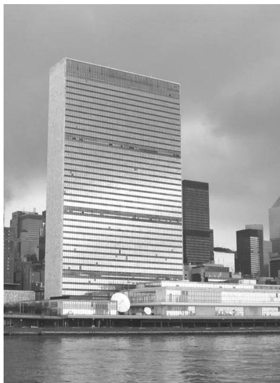
Zgrada Ujedinjenih nacija u Njuorku