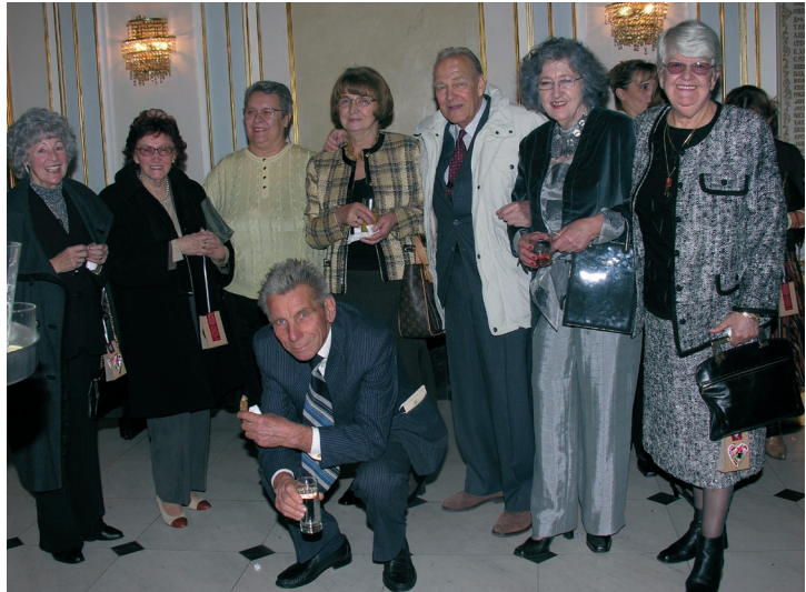
Penzioneri Udruženja banaka

Bilo je mnogo iskušenja, i problema, i neizvesnosti. Ratovi, reforme, ideologije... Ali je uvek postojala svest o neophodnosti udruženja banaka preko kojeg su banke mogle