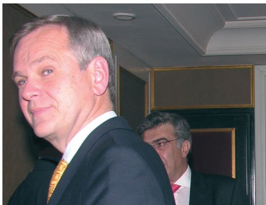
Aleksander Aleksejev, ambasador Ruske federacije