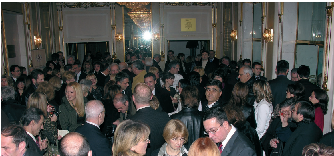
Zvanice na koktelu

Dragi prijatelji Udruženja banaka Srbije!